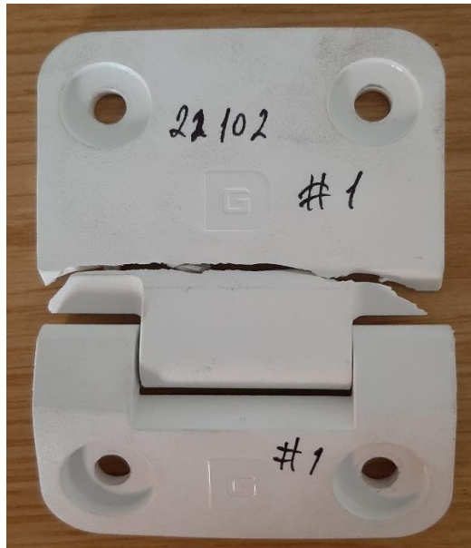
Amostra / Sample #1