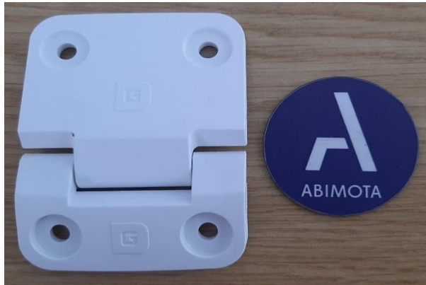
Figura 1 - Foto da amostra Figure 1 - Sample photo

Os resultados detalhados, são apresentados nas folhas seguintes. The detailed results, are presented in the following pages.