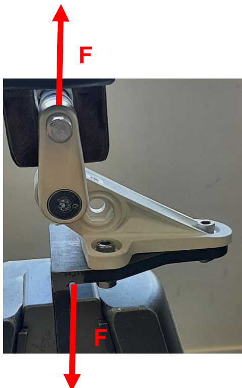
Figura 2 - Esquema de aplicação da carga Figure 2 - Load application scheme

Os resultados expressos neste relatório referem-se às amostras ensaiadas. Reprodução parcial proibida. Test results are only available for the sample identified in the present test report. This document may only be reproduced in full.