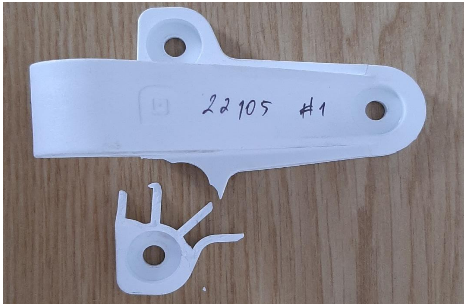
Amostra / Sample #1

Os resultados expressos neste relatório referem-se às amostras ensaiadas. Reprodução parcial proibida. Test results are only available for the sample identified in the present test report. This document may only be reproduced in full.