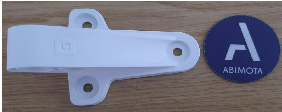
Figura 1 - Foto da amostra Figure 1 - Sample photo

Os resultados detalhados, são apresentados nas folhas seguintes. The detailed results, are presented in the following pages.